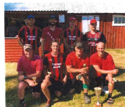
Vinnande lag VM Frampärk 2022