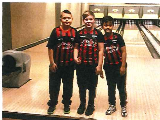
Stånga U Juniorligan december 2022

Inför seriestart 2022/2023 så ser det likadant ut gällande antal lag och deltagande i samma seriespel tom 2021/2022 förutom att vi deltar med ett lag i Gotlandsserien A (8-manna, mix-lag) och ett lag i Gotlandsserien B (4-manna, ungdomar).